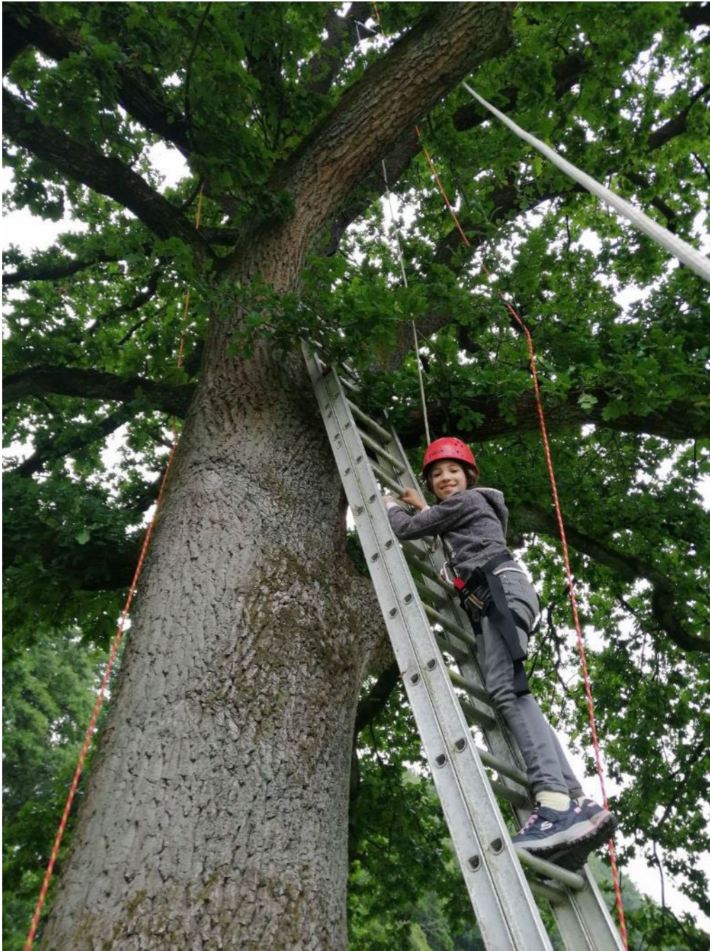
Beim Klettern in der alten Eiche konnte manches Kind seine Höhenängste überwinden.