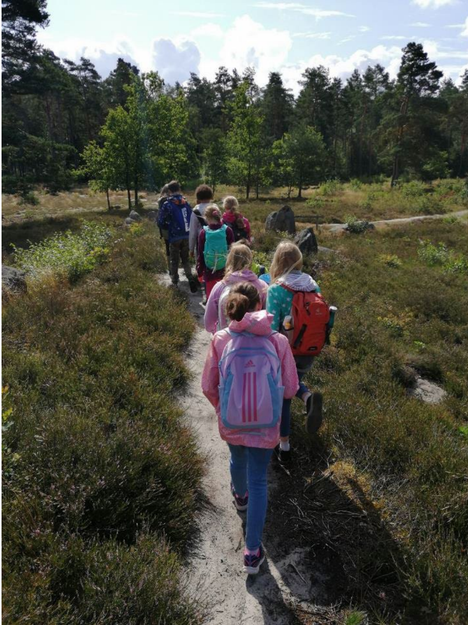
Während der Wanderung zur Oldendorfer Totenstatt hielt sich das Wetter zum Glück.